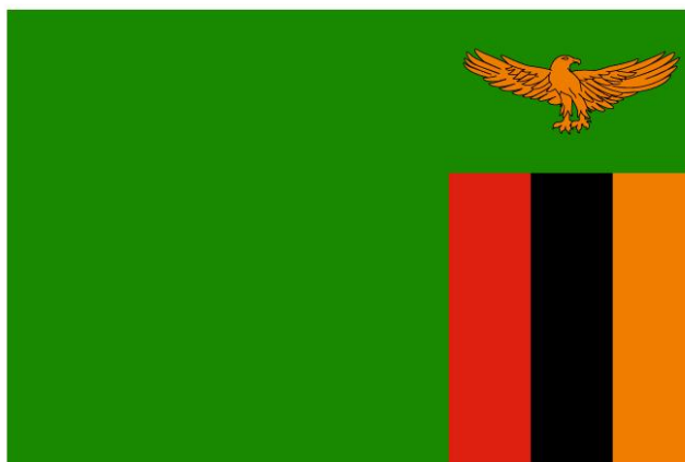
图 2 赞比亚国旗

赞比亚经济连续多年实现正增长，但近年增长速度有所下滑。根据世界银行数据，2016 年，赞比亚经济增长率为 3.8%，2017 年增长 3.5%，2018 年增长 4.0%，2019 年增长 1.4%。2020 年，受新冠肺炎疫情等因素影响，赞比亚经济遭受冲击，全年国内生产总值（GDP）约合 193.2 亿美元，同比下降 3%。