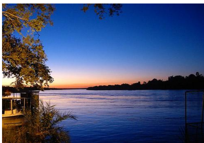
图 3 赞比亚风景

赞比亚是世界贸易组织创始成员国。赞比亚是东南非共同市场（COMESA）和南部非洲发展共同体（SADC）的成员国。2021 年 2 月，赞比亚向非盟委员会提交了非洲大陆自由贸易区协议的批准书，成为非盟第 36 个完全加入该协议的成员国。